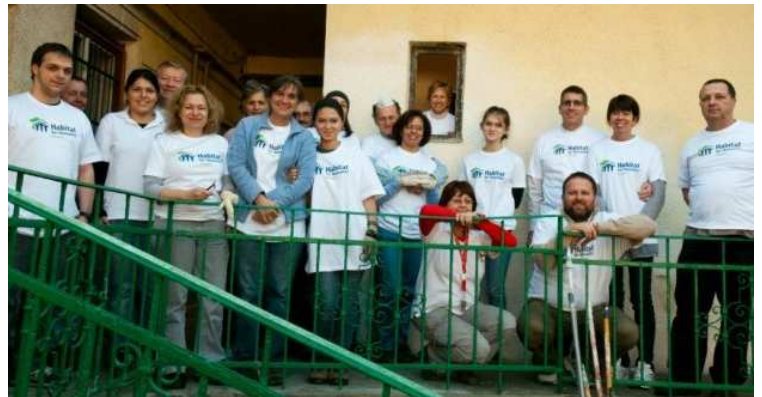
Önkéntesek a Vöröskereszt Ady Endre úti nappali melegedőjében

Intézményi programunk keretében 2011-ben a Mozgássérült Emberek Rehabilitációs Központjában szobákat és folyosókat, a Máltai Szeretetszolgálat II. Kelta utcai Szociális Központjánál termeket és folyosókat festettünk, a Vöröskereszt XIX. Ady Endre úti Nappali Melegedőjében szobákat festettünk, lambériát szereltünk fel, és megszüntettük a vizesedést a pincében, a Vöröskereszt XIII. kerület Madridi utcai Hajléktalanszállójában pedig kifestettük a folyosókat.